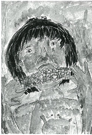
『とうもろこし きゅうしよく』

※わたしがとうもろこしを たべているところです。 とうもろこしきゅうしよ くのときたべたとうもろ こしは、とてもおいしか つたです。