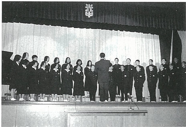
▲合唱コンクールで総合優勝に輝いた3年1組