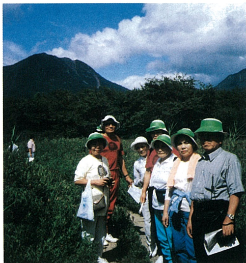
▲ 暑さを忘れ自然に親しみました

8月8・9日、公民館事業の一つとして、戦場ヶ原ハイキングが行われました。当日の天気は、よく澄んだ青空で、参加者は高原の涼風と自然を満喫していました。