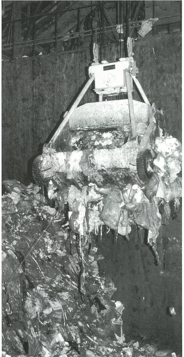
1日平均約35tを処理する

八日市場市ほか三町環境衛生組合（八日市場市・多古町・野栄町・光町で構成）に伺い、現在ゴミ処理を行って一番問題になっていることを尋ねたところ、「燃えるゴミと燃えないゴミの分別がされていない」「組合指定の袋を使用しないでゴミステーションに出してある。」「燃えるゴミの水切りがあまりい」という回答でした。