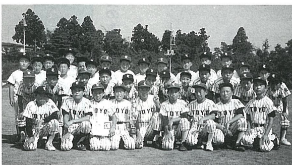
優勝した東陽スポーツ少年団