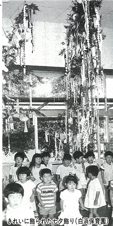
きれいに飾られた七夕飾り(白浜保育園)

七夕を明日にひかえた6日 由る七夕集会が行われました。日吉小学校で、全校児童に七夕飾りがつけられた体育