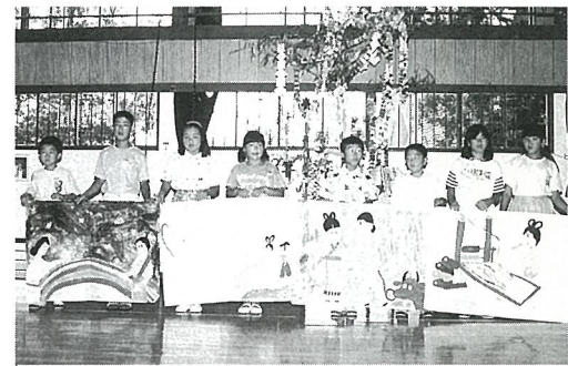
集会委員のみなさんが作った「七夕の物語」

館の中で、集会委員により進められました。日吉小学校の七夕集会は、行事からんだ始めての大きな集会でした。