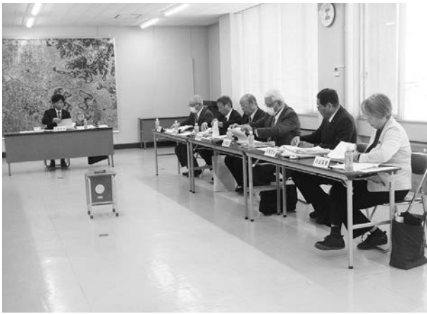
▲民生文教常任委員会

Q 教育課 校務支援システムを使用することにより、時間外の超過勤務時間80時間を超えが、小学校では30%程度、中学校では50%超えであったものが、令和5年10月、11月の調査では、小学校で10%、中学校では30%をきっており、超過勤務の削減に効果を発揮しています。