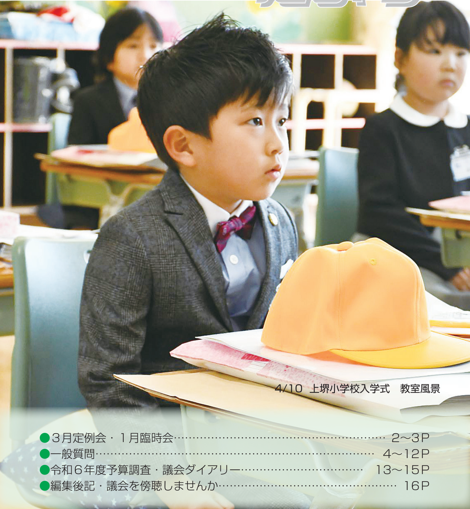
4/10 上堺小学校入学式 教室風景