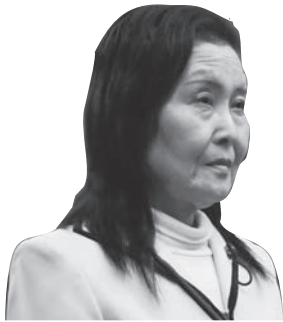
森川 貴 恵 議員