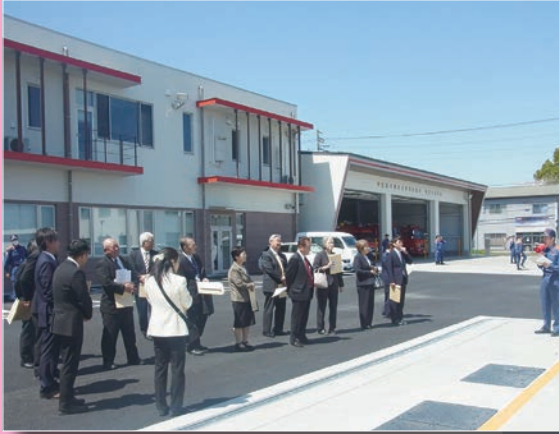
横芝光消防署視察 (4月10日)