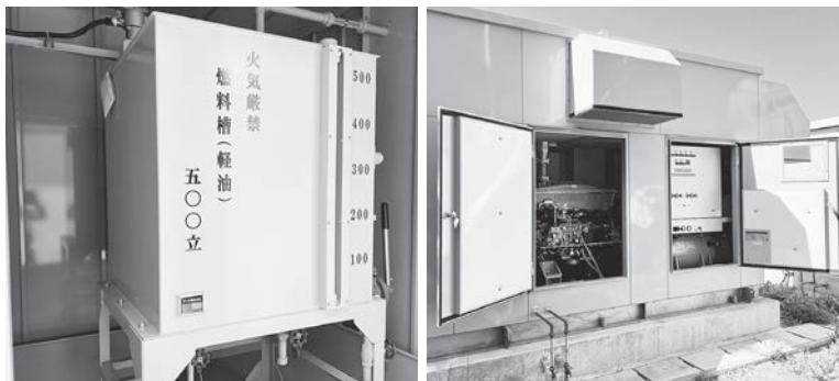
▶非常用発電機 (東陽病院)

に確立されているか。町では、町内4施設と、山武市内にある障害者支援施設等の19施設と福祉避難所の協定を締結しているが、広域での協定