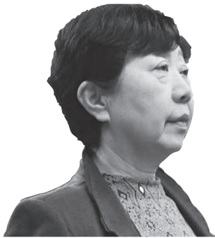
川島 富士子 議員