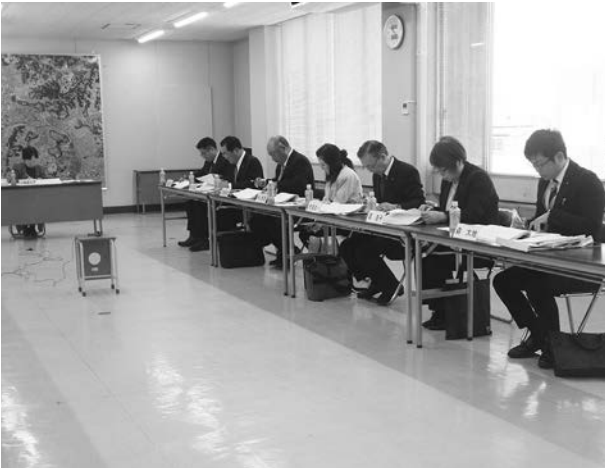
▲総務経済常任委員会

ハラスメント相談窓口とストレスチェック制度の業者は同一であり委託している業務内容は国が推奨している57項目の調査、集計し個人情報尊重し各課長に提供している。